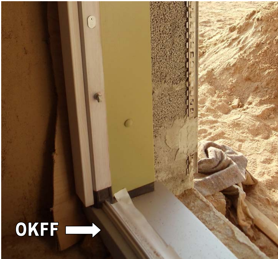
Der Anschluss des fertigen Fußbodens kann oberflächenbündig mit OK Rahmen erfolgen